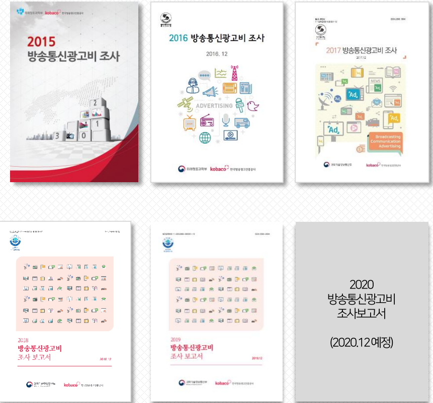
배포용 조사보고서 ▲